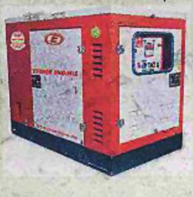
Andhra Jyoti | Jan 28, 2015

హైదరాబాద్. (ఆంధ్రజ్యోతి విజనెస్) : టాఫ్ మోటార్స్ ట్రాక్టర్స్ లిమిటెడ్ (టిఎంటి ఎల్) తక్కువ హార్వెస్టర్తో కూడిన 5/7.5 కెవి డీజిల్ జనరేటర్ల (డిజి)ను విడుదల చేసింది. 1500 ఆర్పిఎం (రోటేటింగ్ వర్ మినిట్)తో 5/7.5 కెవి డీజి సెట్లను తీసుకు రావటం ఇదే తొలిసారిని తెలిపింది. కొత్త డీజి సెట్లు వినియోగదారులకు నమ్మకమైన, అధికవరమైన ఖరీదైనవిగా పేరొంది. రెసిడెన్షియల్ ప్రాంతాలు, చిన్న దుకాణాలు, కమర్షియల్, బ్యాంకింగ్ రంగాలకు ఉపయోగపడే విధంగా ఈ జెన్ సెట్లను తయారు చేసినట్లు తెలిపింది. ఐవర్ కలక్షన్లలో టిఎంటిఎల్ 5/7.5 కెవి డీజిల్ సెట్లను రూపొందించినట్లు వెల్లడించింది.