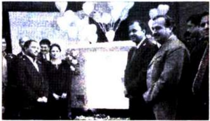
జనరేటర్ను ఆవిష్కరిస్తున్న సంస్థ ప్రతినిధులు

హైదరాబాద్: టాఫె పూర్తిస్థాయి అనుబంధ సంస్థ టాఫె మోటార్స్ అండ్ ట్రాక్టర్ లిమిటెడ్(టిఎంటిఎల్) దేశవ్యాప్త ఆవిష్కరణలో భాగంగా, తక్కువ అశ్వశక్తి(హార్ప్ పవర్-హెచ్పీ) శ్రేణి 5/ 7.5 కెవిఎ డీజిల్ జనరేటర్లను బుధవారం హైదరాబాద్లో ప్రవేశపెట్టింది. 5/ 7.5 కెవిఎ డీజిల్ జనరేటర్లకు శక్తిని అందించేందుకు 1500 ఆర్పిఎంతో ఇంజిన్లను భారత దేశంలో ప్రవేశపెట్టిన తొలి కంపెనీగా టిఎంటిఎల్ నిలిచింది. దీనిని విశ్వసనీయత, విద్యుత్ నాణ్యత మెరుగుపడేలా రూపొందించింది. దేశవ్యాప్త ఆవిష్కరణ హైదరాబాద్లో చివరగా నిర్వహించారు. మార్కెట్లో ప్రస్తుతం ఈ శ్రేణిలో అందుబాటులో ఉన్న డీజిల్ సెట్స్ 3000 ఆర్పిఎంతో పవర్తో కూడిన ఆటోమొబైల్ అప్లికేషన్ ఇంజిన్లతో లభించేవే గాక 5/ 7.5 కెవిఎ డీజిల్ అవసరాలకు సర్దుబాటు అయ్యేలా